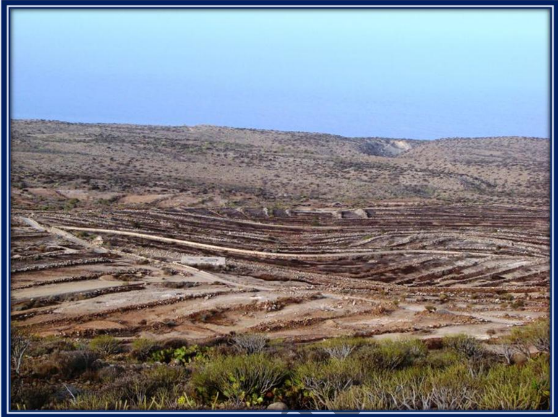
Numerosos huertos en estado de abandono nos indican lo importante que fue la agricultura en su momento