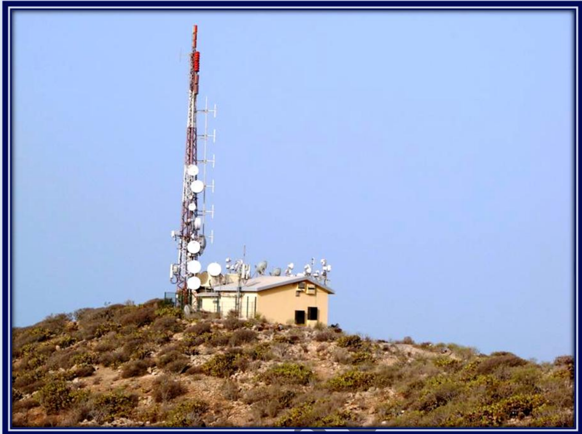
Nos encontramos varias edificaciones con numerosas antenas