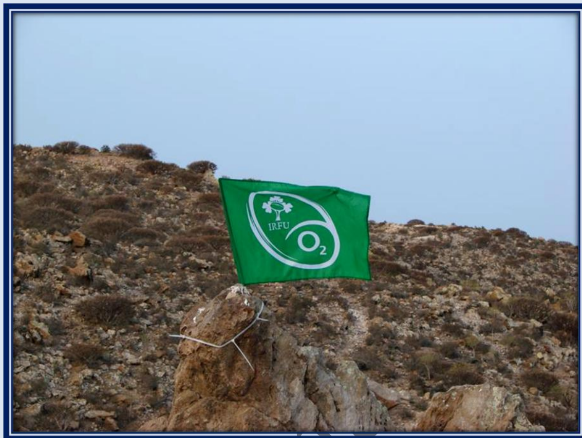
Hemos finalizado el primer tramo del sendero