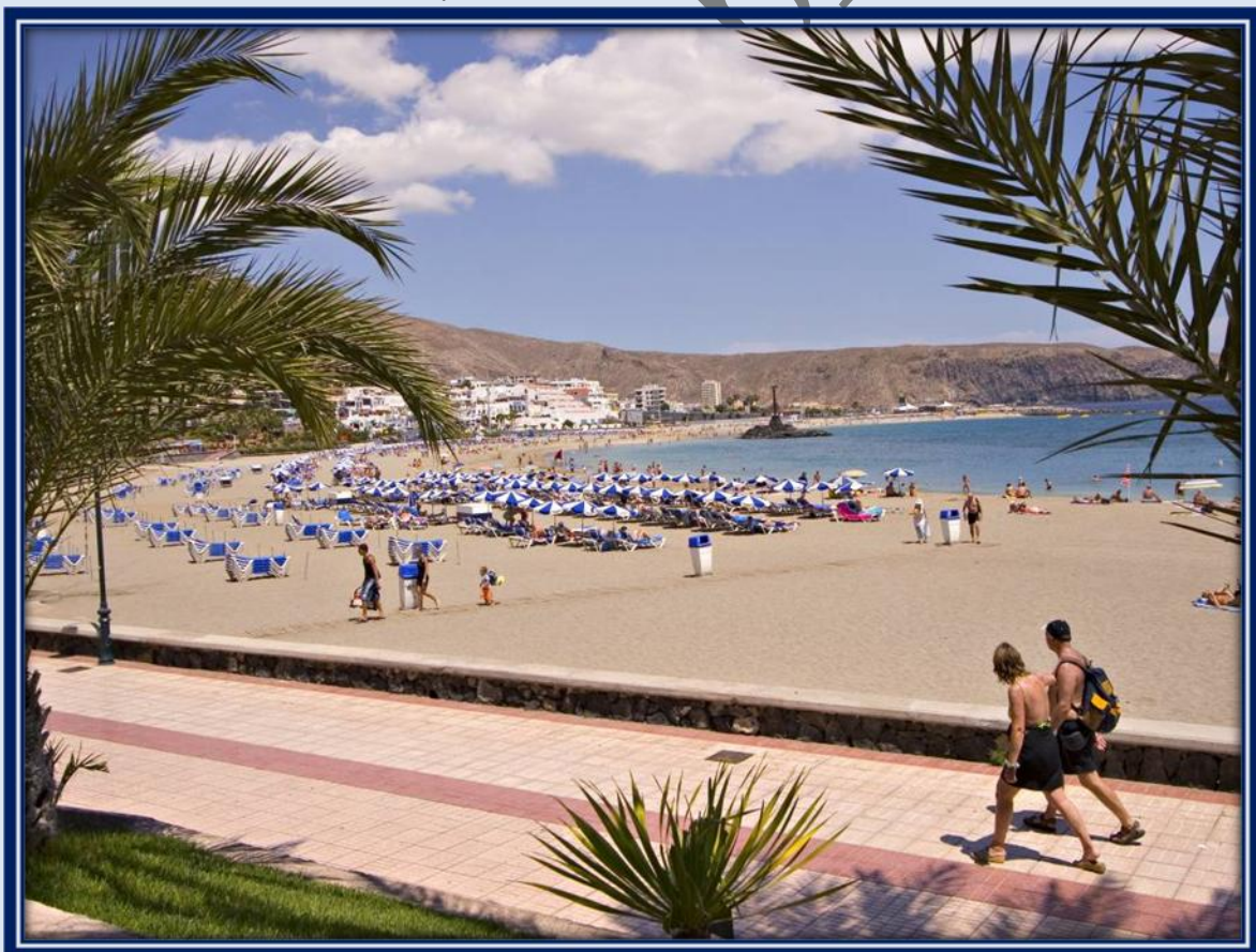
Desde este lugar de la Playa Las Vistas, iniciamos nuestro recorrido.