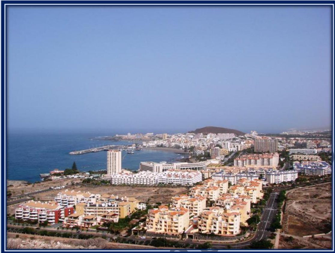
Ya estamos en el descenso y el sol comienza a calentar.