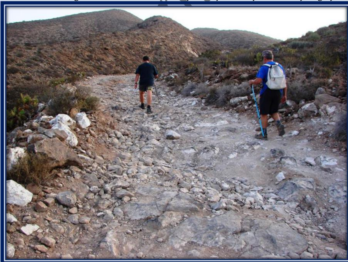
Se puede apreciar el deterioro de la pista por donde se accede al lugar donde se encuentran las antenas