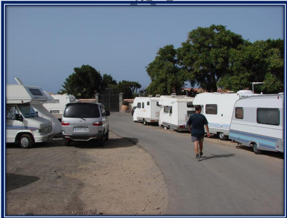
Al llegar a la costa nos encontramos este camping y numerosas caravanas.