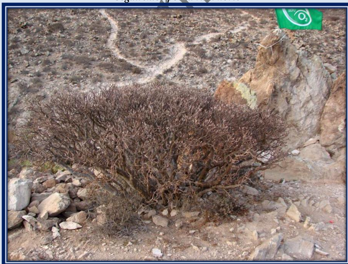
Numerosos caminos recorren lo alto de la Montaña de Guaza