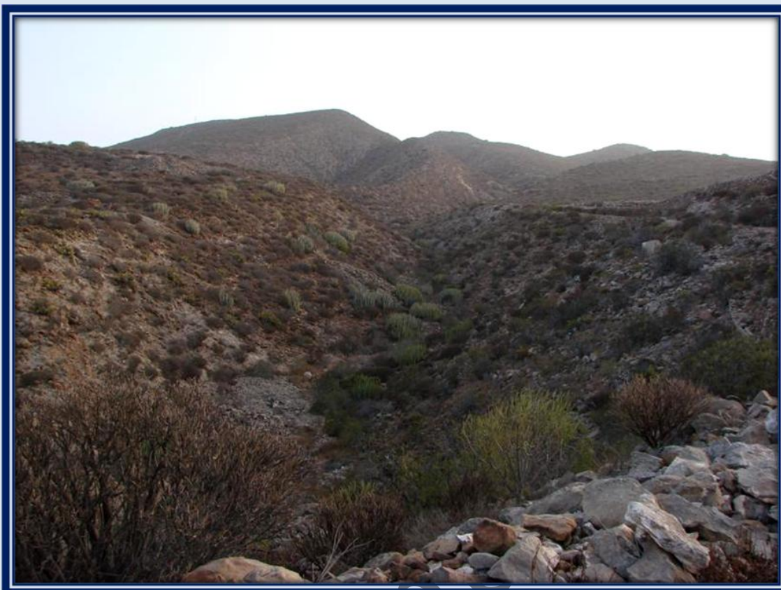
Pretendemos llegar a la montaña más alta que se aprecia al fondo de la fotografía