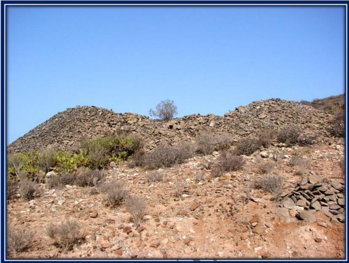
Abundan las canteras donde en su momento se extrajo gran cantidad de piedra.