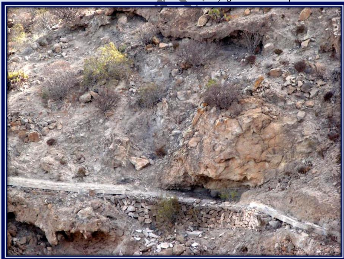
Viejo canal en estado de abandono por donde llegaba el agua que regaba la zona