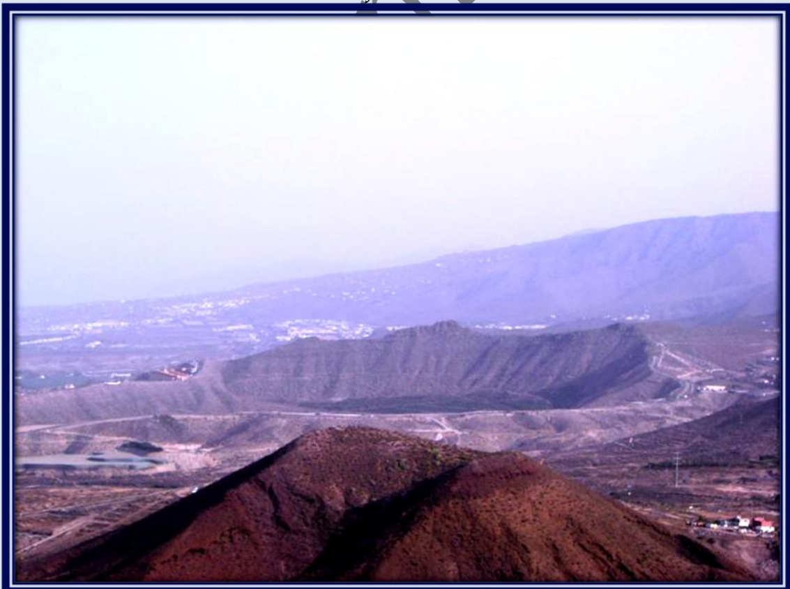
Al fondo observamos un cráter y en su interior cultivo de plataneras