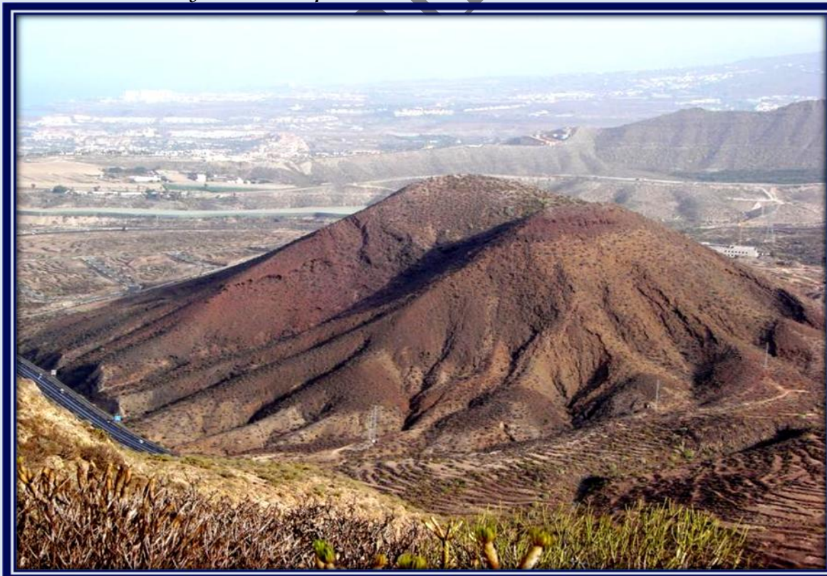
Desde lo alto se puede divisar la Montaña El Mojón de 285 metros de altitud