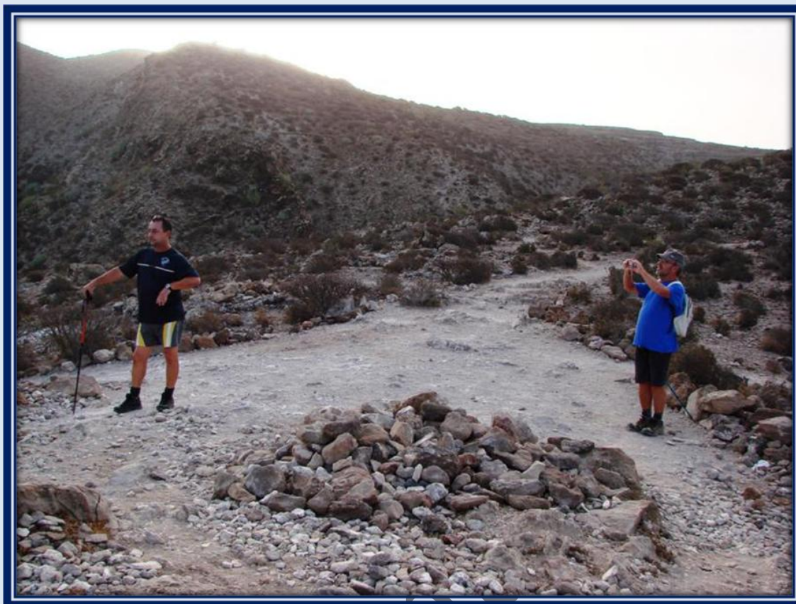
Seguiremos por la ruta norte