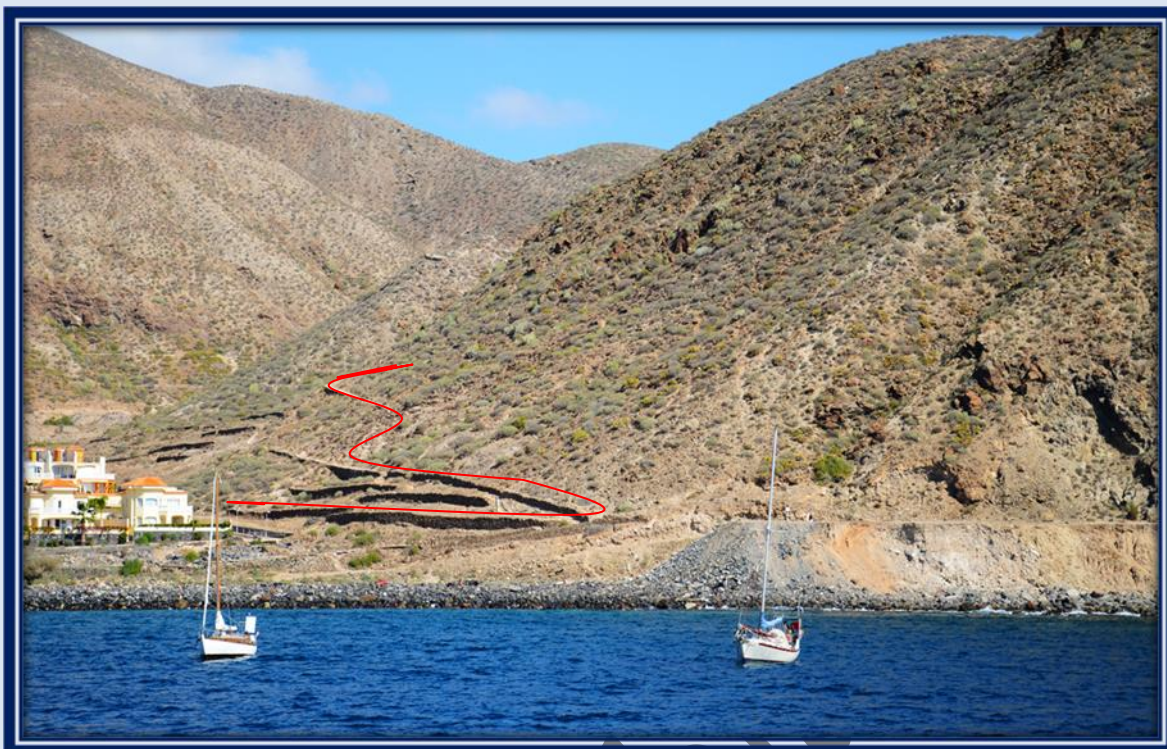
Desde este lugar apreciamos el comienzo del sendero