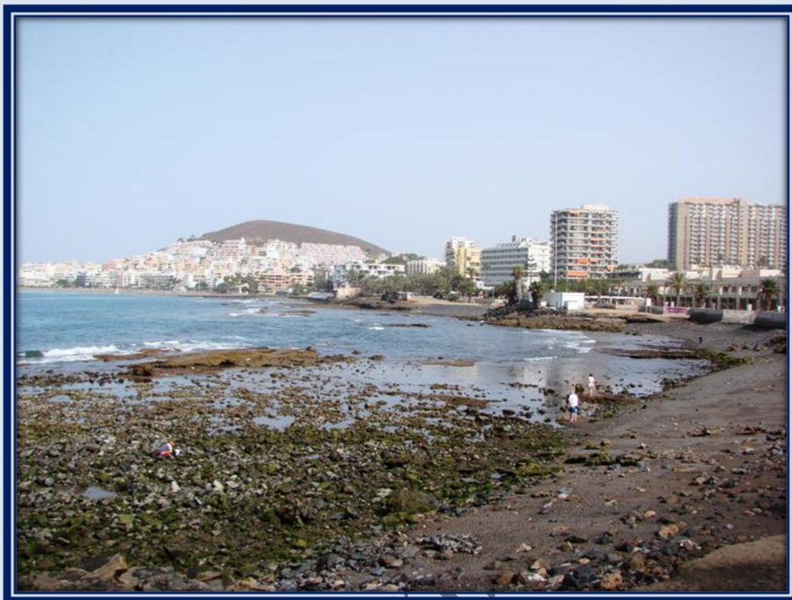
La bajamar muestra este lugar donde numerosas personas se encuentran cogiendo "carnada"