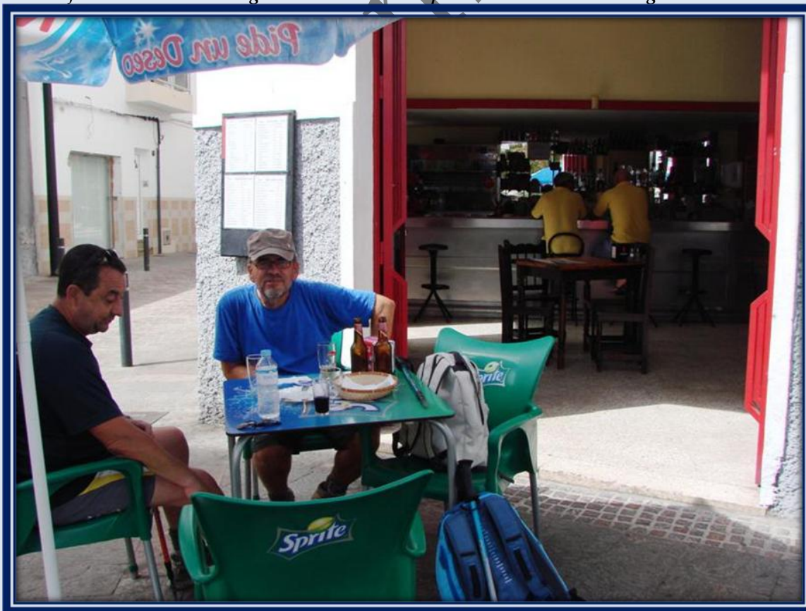
Para finalizar un copioso desayuno en el restaurante "El Nuestro"