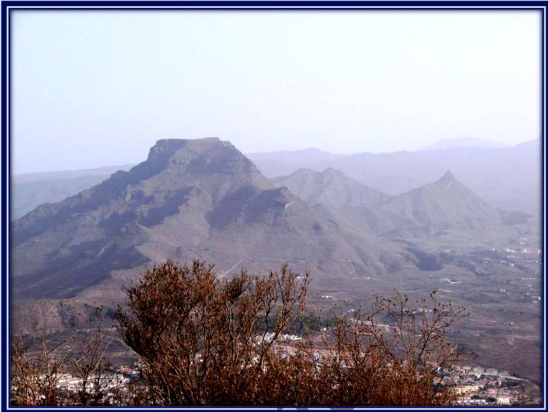
La calima no impide apreciar el bello paisaje montañoso, destaca el Roque del Conde en primer lugar.