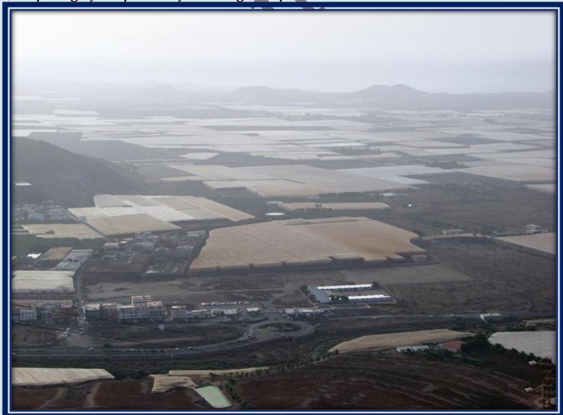
Si miramos en dirección al este, divisamos numerosos invernaderos en la zona de Los Abrigos y Las Galletas.