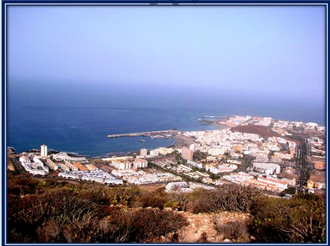
Bahía de Los Cristianos y zona turística