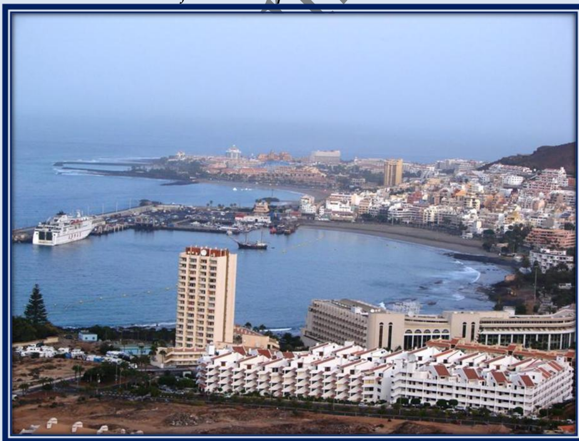
Los Cristianos y playa Las Vistas.