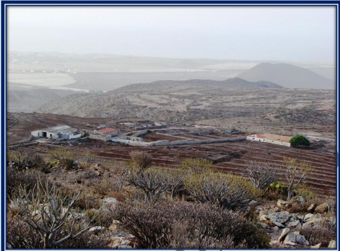
Algunas construcciones en ruinas como dos naves o empaquetados se encuentran en esta zona, lo que significa que este fue un lugar importante en la economía de la comarca.