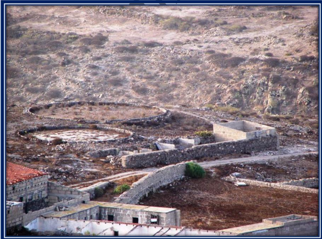
Por las eras pensamos que aparte de los tomates, los cereales tuvieron su importancia