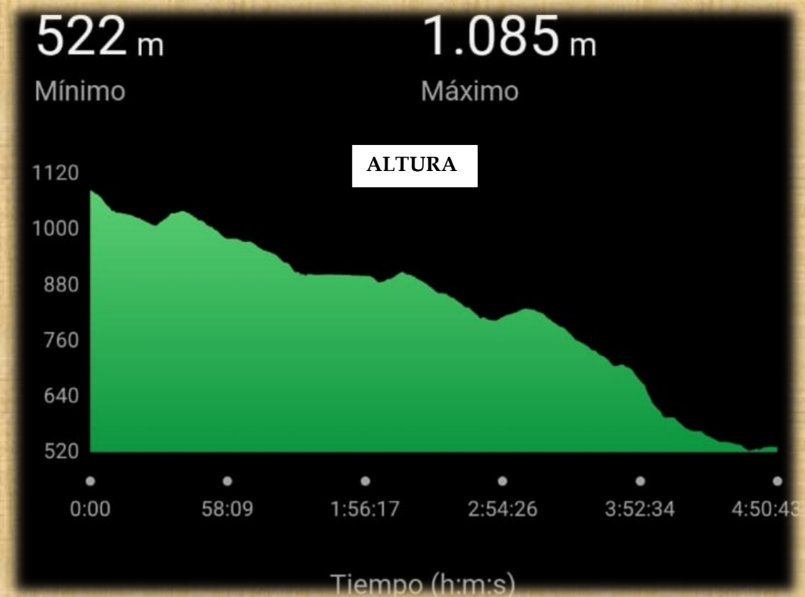
Altitud y tiempo