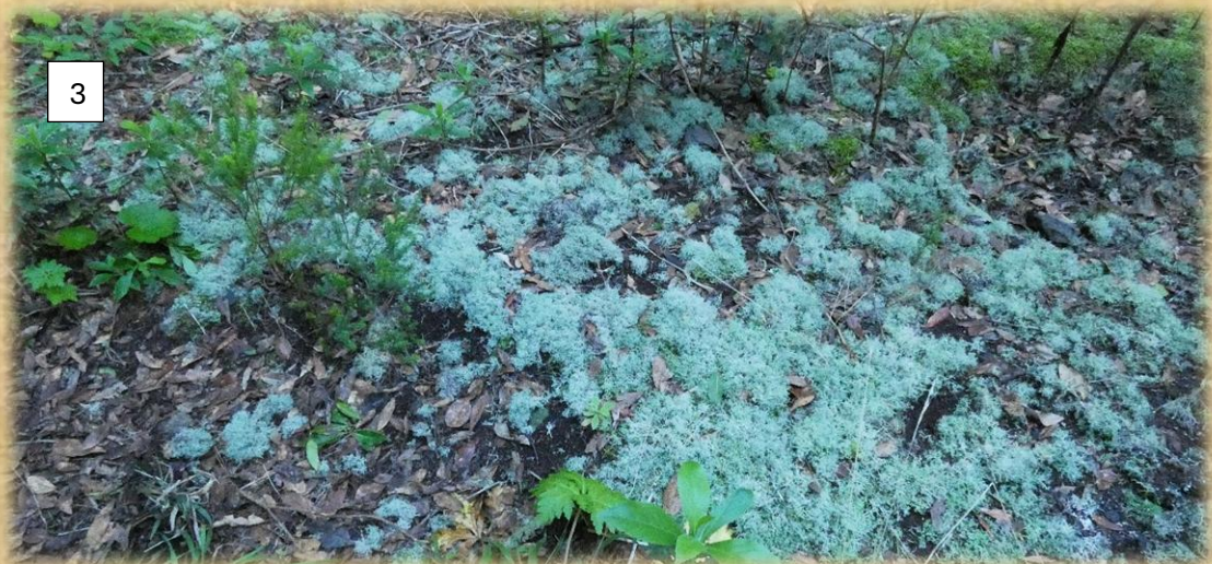
1.Desayunamos en el cruce del sendero a Los Silos. 2. Vista del Teide nevado. 3. Líquenes y pequeñas plantas de la laurisilva en fase de crecimiento.