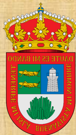
Buenavista del Norte