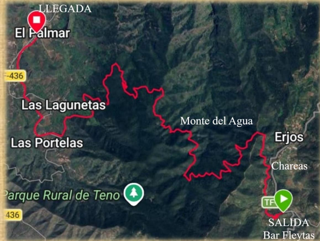
Mapa del recorrido