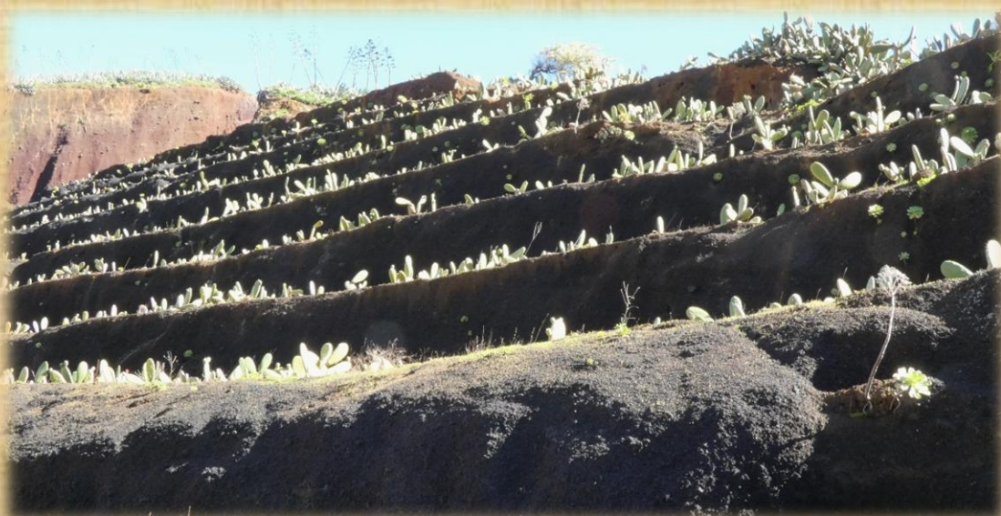
1. Montaña de la Zahorra, explotada entre los años 60 a 80 del siglo pasado para la extracción de zahorra. 2. Calvario en la entrada de El Palmar. 3. Siembra de tuneras en una de las laderas de la montaña de la Zahorra.