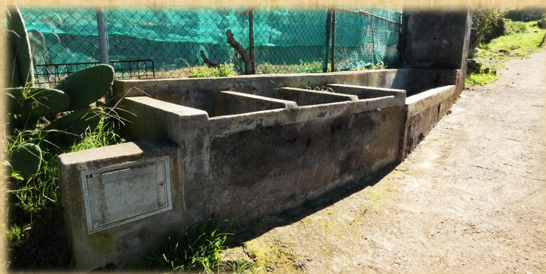
1.Caserío de Las Portelas. 2.Cruce de senderos. 3. Lavadero y abrevadero en el camino de Las Portelas a El Palmar.