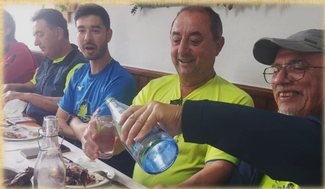
Comiendo en el restaurante asadero El Palmar en Buenavista del Norte.