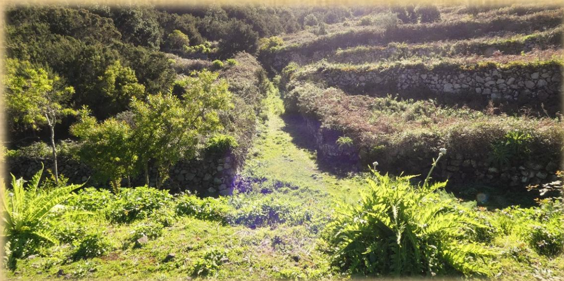
Valle de Las Portelas y El Palmar