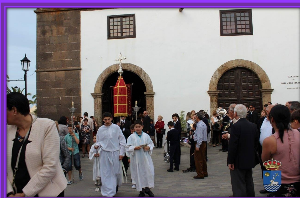
Comienza la Procesión Magna, donde participan todas las imágenes que han salido durante la Semana Santa.