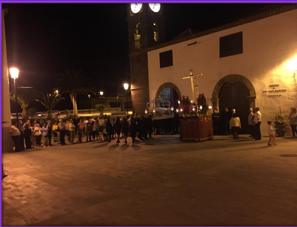
Entrada en el templo del Señor en la Urna o el Santo Entierro