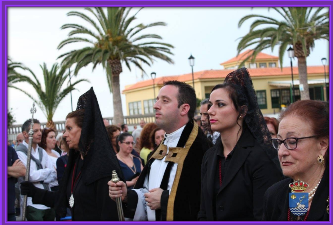
El sacerdote acompañado por miembros de la Hermandad del Cristo de los Dolores.