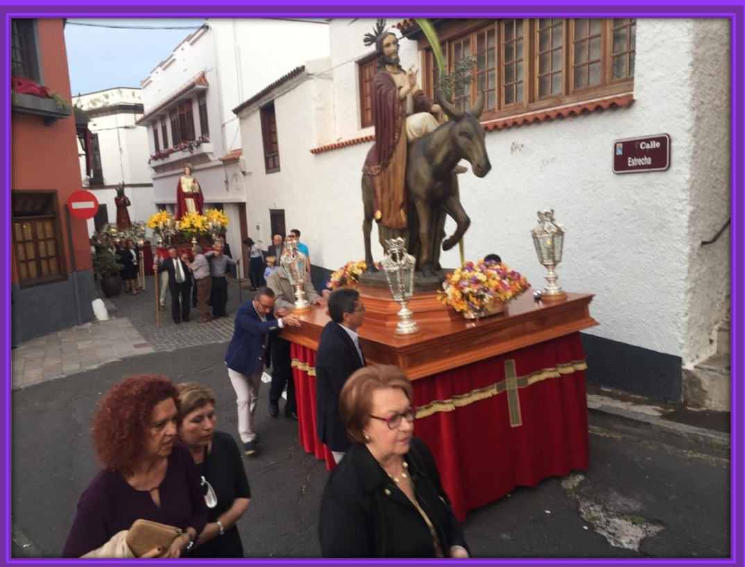
El séquito a su paso por la Plazoleta