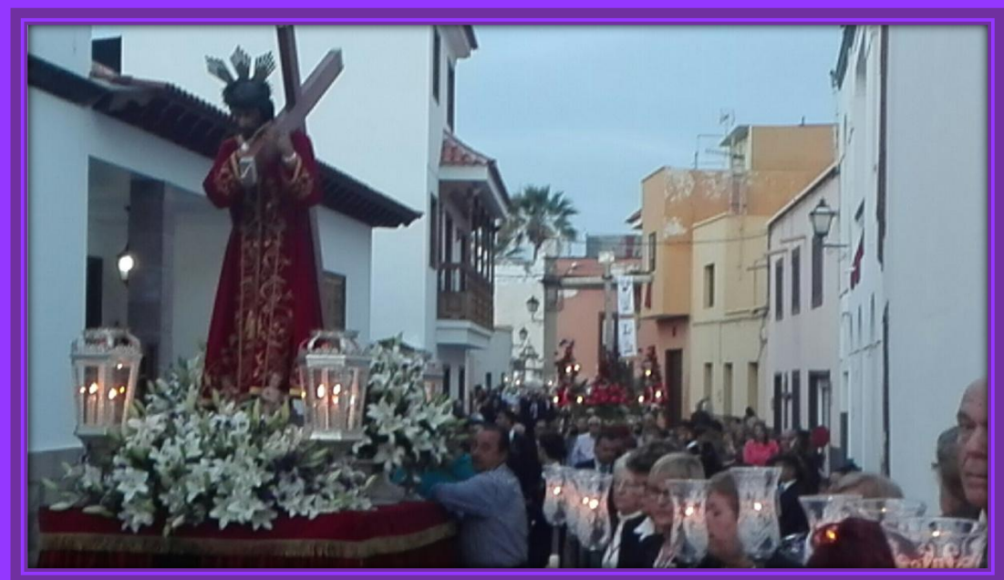
Jesús Nazareno y la Santa Cruz y el Santo Entierro a su paso por la calle Estrecha