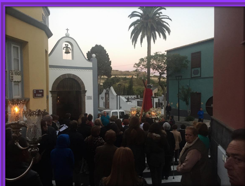
La Imagen del Nazareno llega al Calvario. Situado en el viejo cementerio eclesiástico.