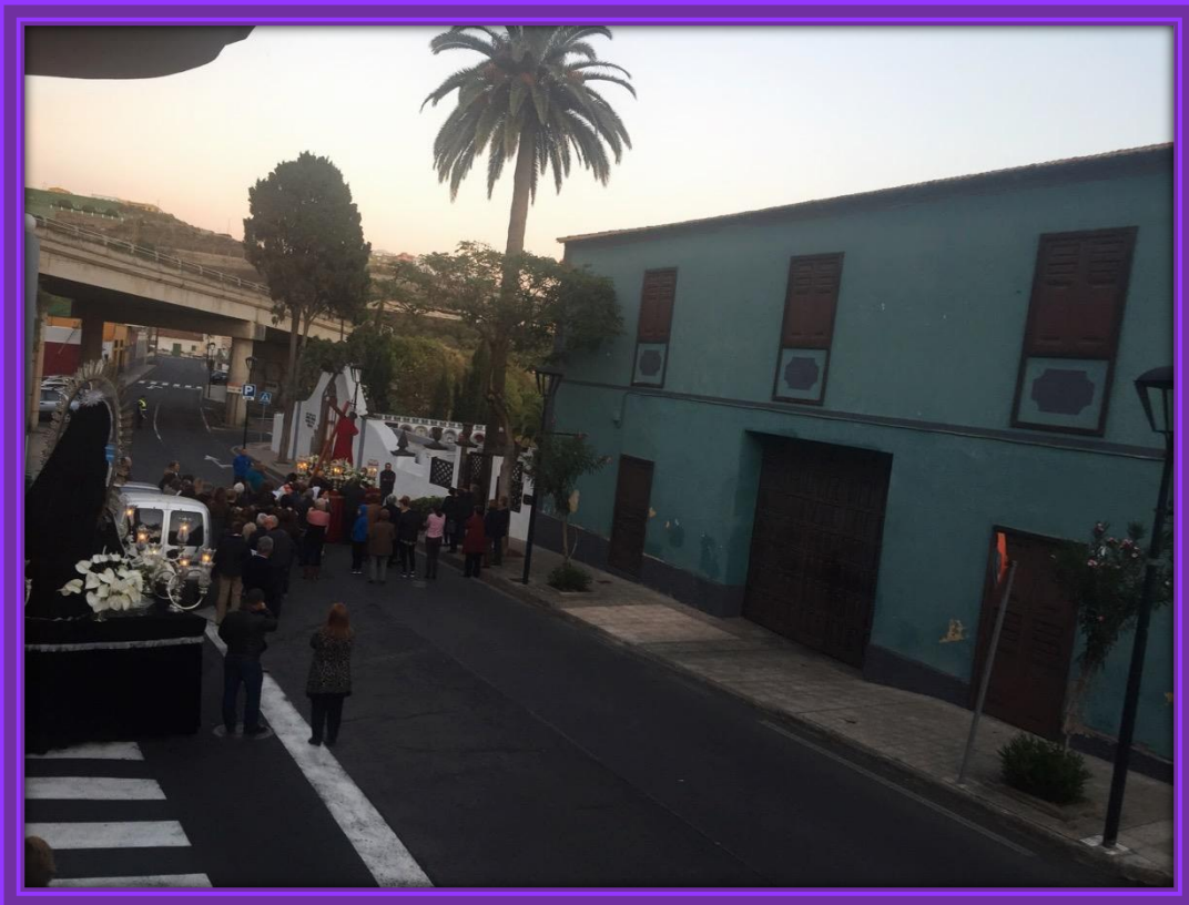
Nuestra Señora de los Dolores espera el paso de su Hijo.