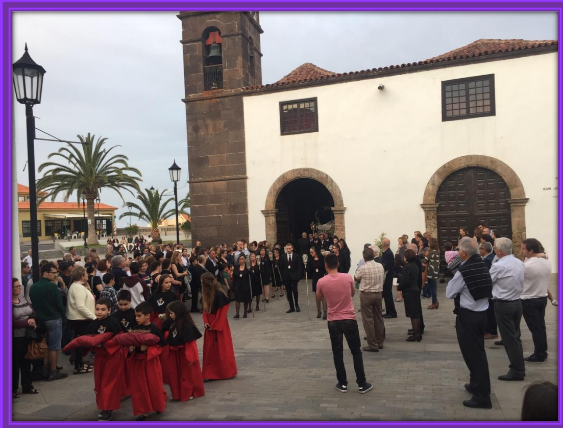
Los más pequeños son también partícipes del cortejo.