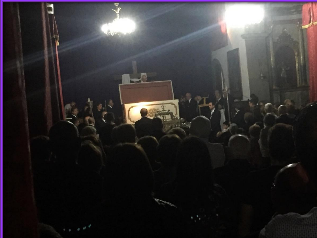
Silencio "sepulcral" cuando tiene lugar el entierro de Nuestro Señor.