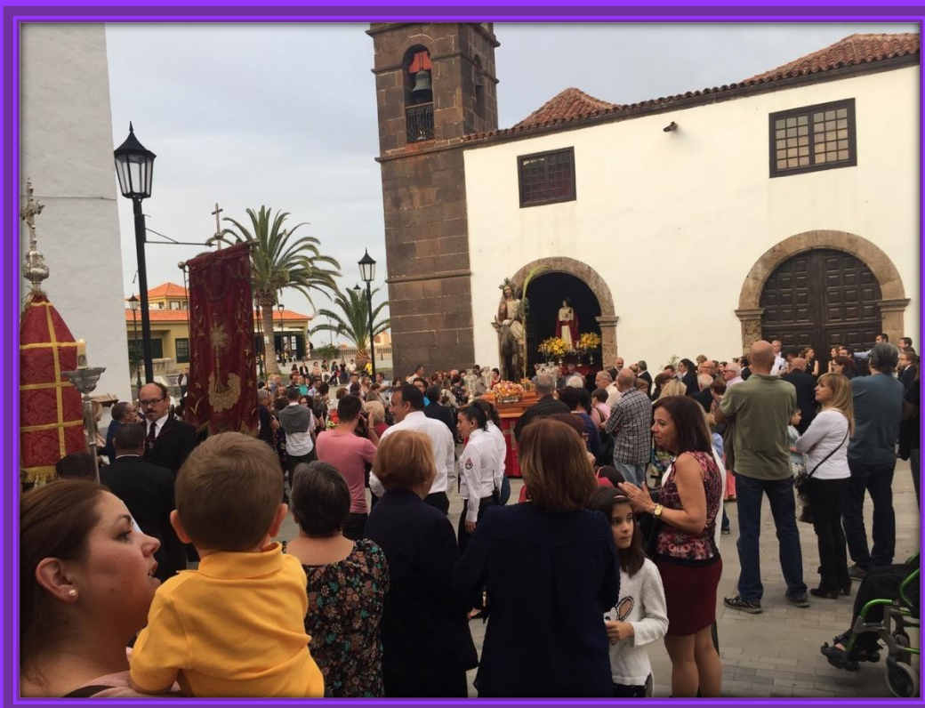
Hacen su salida la imagen de la Entrada de Jesús en Jerusalén y San Juan Evangelista.