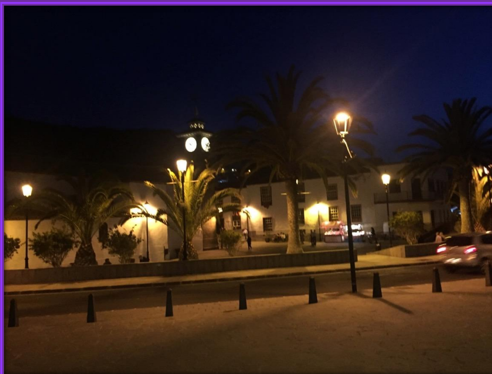
Una vez finalizada la ceremonia los vecinos se recogen para cenar y posteriormente asistir a la Procesión de la Soledad o del Silencio que tendrá lugar a la 23:00 horas.