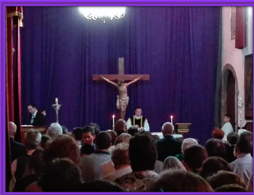
Celebración de la Pasión del Señor.