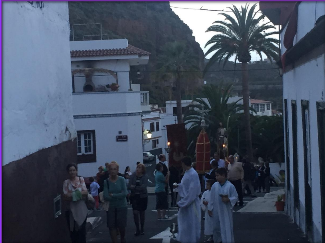
La procesión con su ritmo lento sube la calle El Paso.