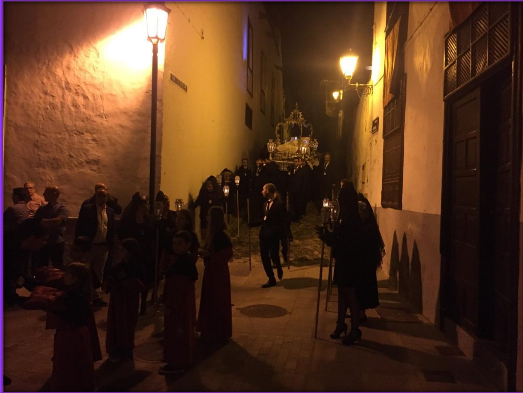
El Santo Entierro acompañado de la Hermandad del Cristo de los Dolores desciende por la calle La Alhóndiga.