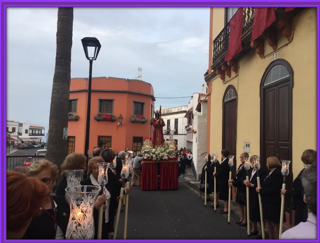
La Hermandad del Santísimo Sacramento.