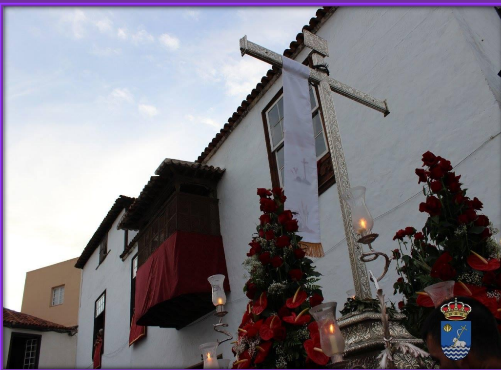
La Santa Cruz con la corona de espinas y sudario.