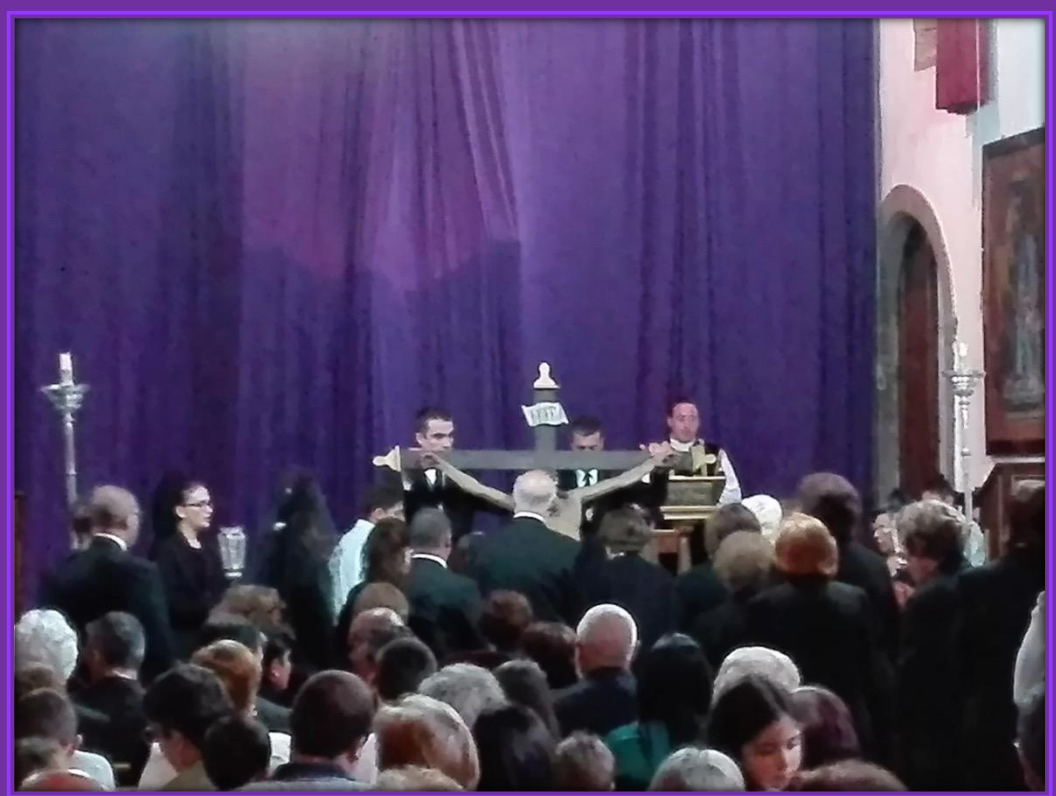
Ceremonia del Descendimiento