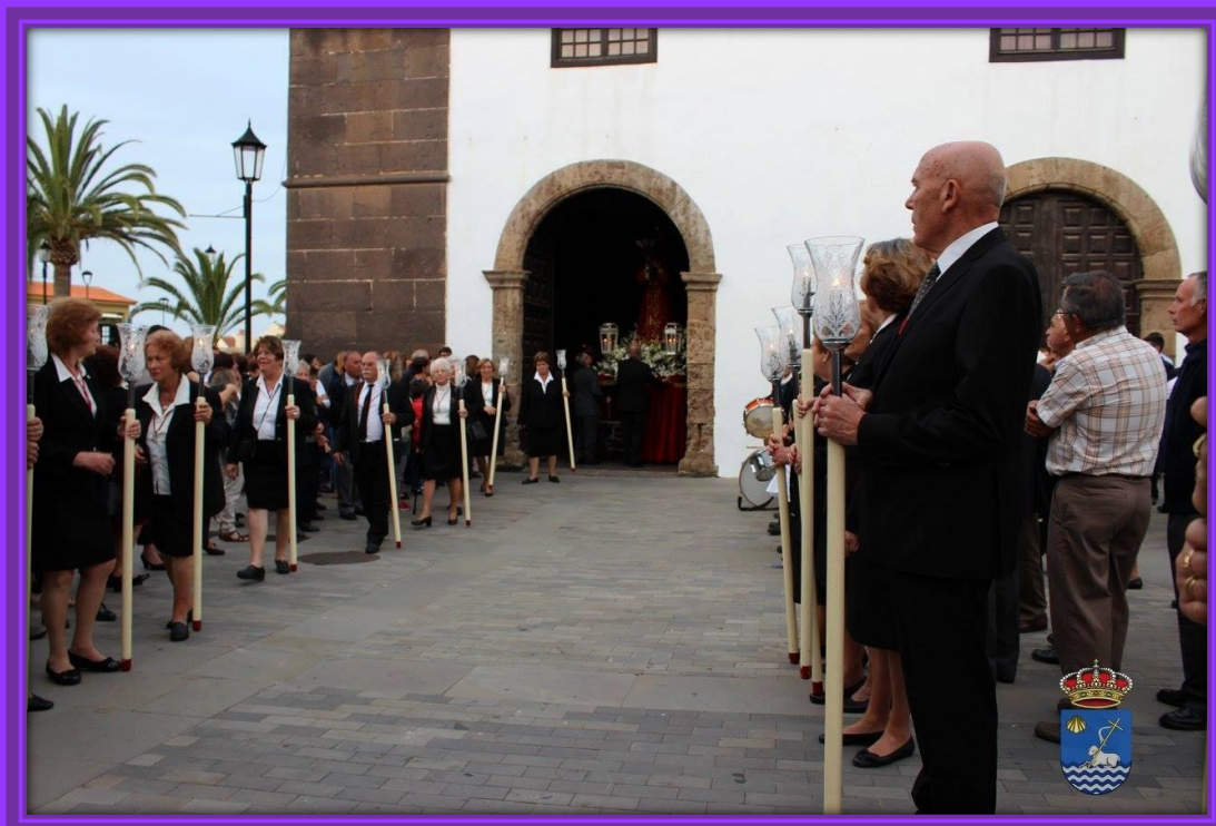
Jesús Nazareno escoltado por la Hermandad del Santísimo Sacramento.