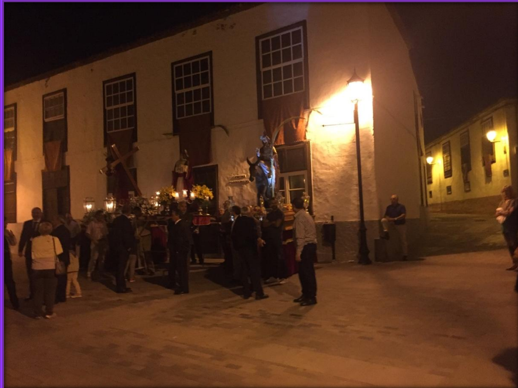
Jesús Nazareno, San Juan Evangelista y la imagen de la Entrada de Jesús en Jerusalén esperan la llegada del Santo Entierro.