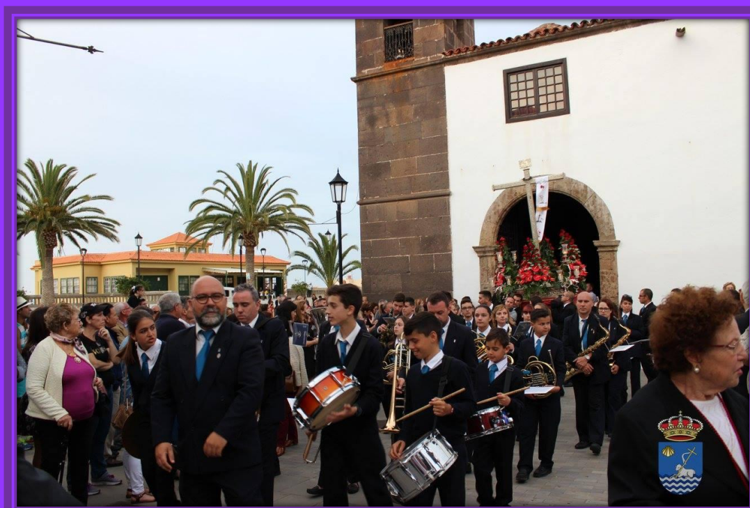
Detrás de la imagen de Jesús Nazareno, la banda de música XIX de Marzo del barrio de San José.