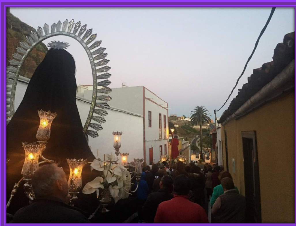
Vía Crucis por la calle El Calvario. Son las 07:00 horas.