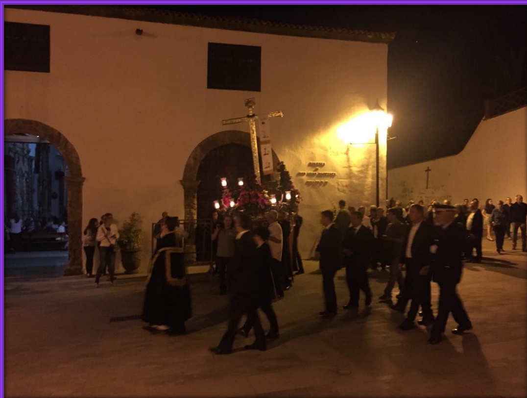
El sacerdote y las autoridades hacen su presencia en el templo.